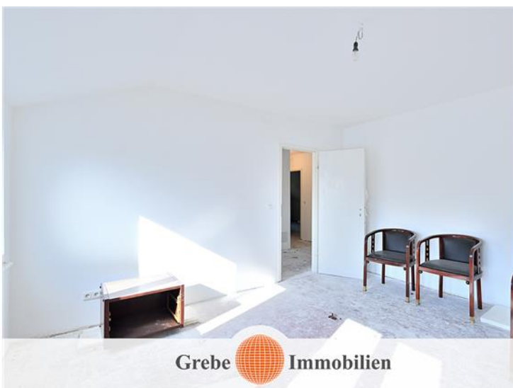
Zimmer 2 im DG Bild 2