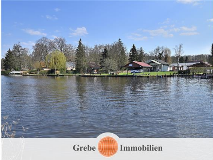
Blick aus WZ