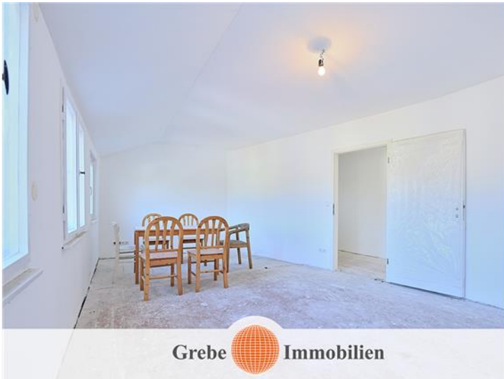
Zimmer 1 im DG Bild 2