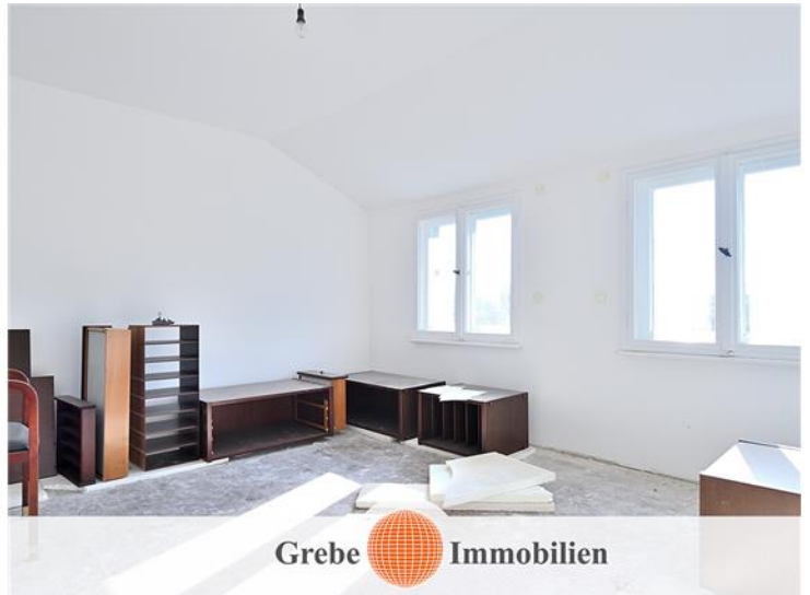
Zimmer 2 im DG