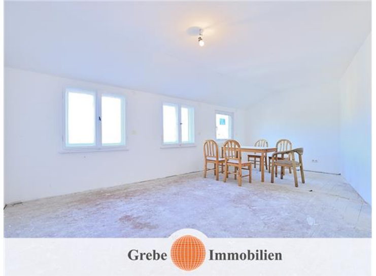
Zimmer 1 im DG